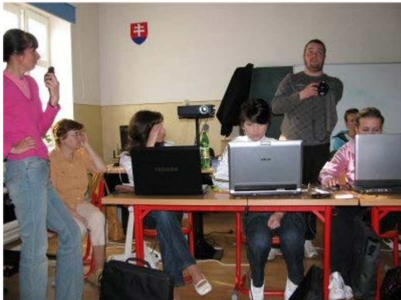
Fotografia č. 2 Kurz digitálnej fotografie - 12.9.2009

Moderné vzdelávanie pre vedomostnú spoločnosť/ Projekt je spolufinancovaný zo zdrojov EÚ