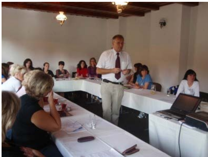
Fotografia č. 5 Školenie k používaniu interaktívnej tabule - Stará Lesná, hotel Kontakt - 25. – 26. 9.2009