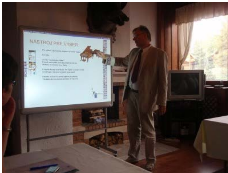
Fotografia č. 4 Školenie k používaniu interaktívnej tabule - Stará Lesná, hotel Kontakt - 25. – 26. 9.2009

Moderné vzdelávanie pre vedomostnú spoločnosť/ Projekt je spolufinancovaný zo zdrojov EÚ