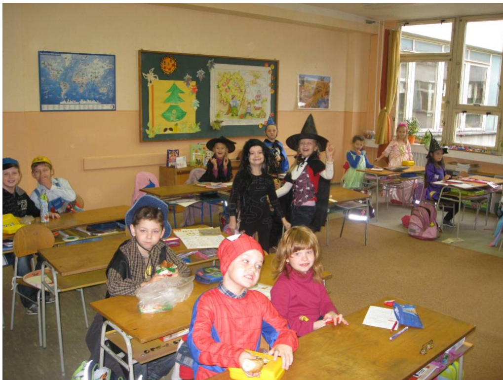
Fotografia č. 6 Moderný prístup učiteľov k žiakom prostredníctvom zobrazenia Halloweenskeho sviatku

Moderné vzdelávanie pre vedomostnú spoločnosť/ Projekt je spolufinancovaný zo zdrojov EÚ