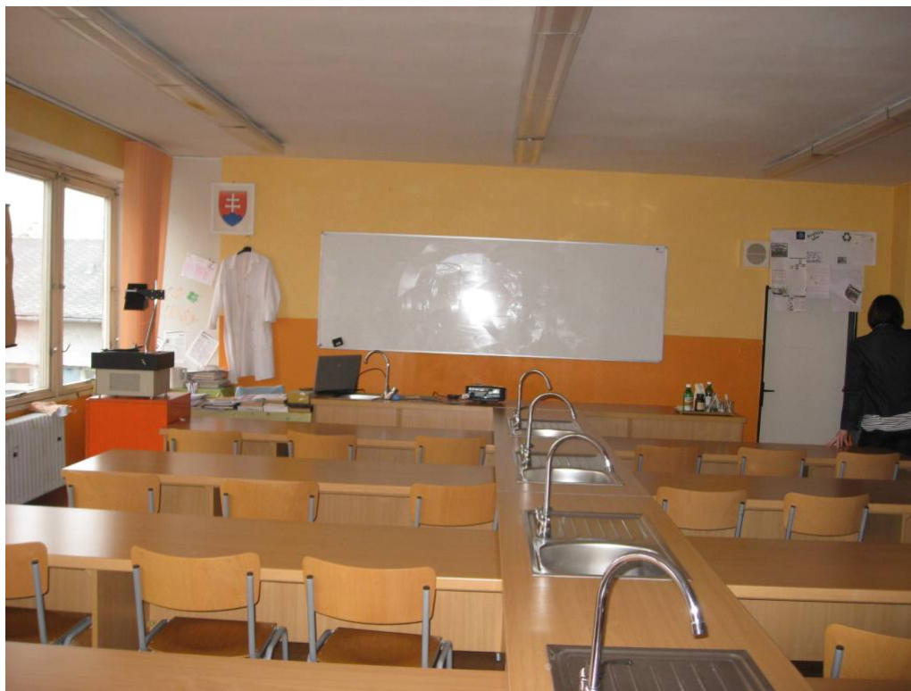
Fotografia č. 2 Zobrazenie novo zakúpených didaktických pomôcok

Moderné vzdelávanie pre vedomostnú spoločnosť/ Projekt je spolufinancovaný zo zdrojov EÚ