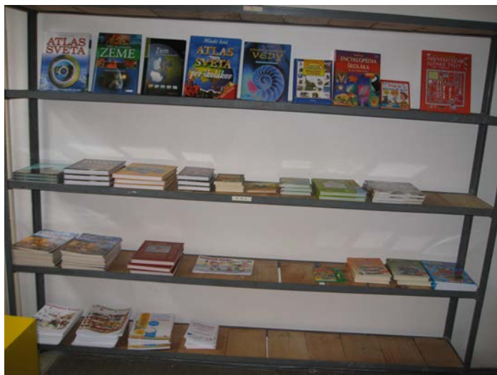
Fotografia č. 5 Novo nakúpená odborná literatúra podporujúca vedomostnú úroveň žiakov