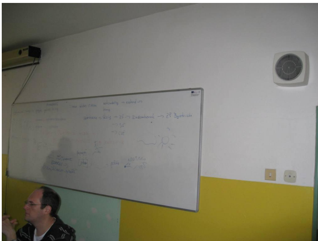
Fotografia č. 1 Využitie novo zakúpených didaktických pomôcok