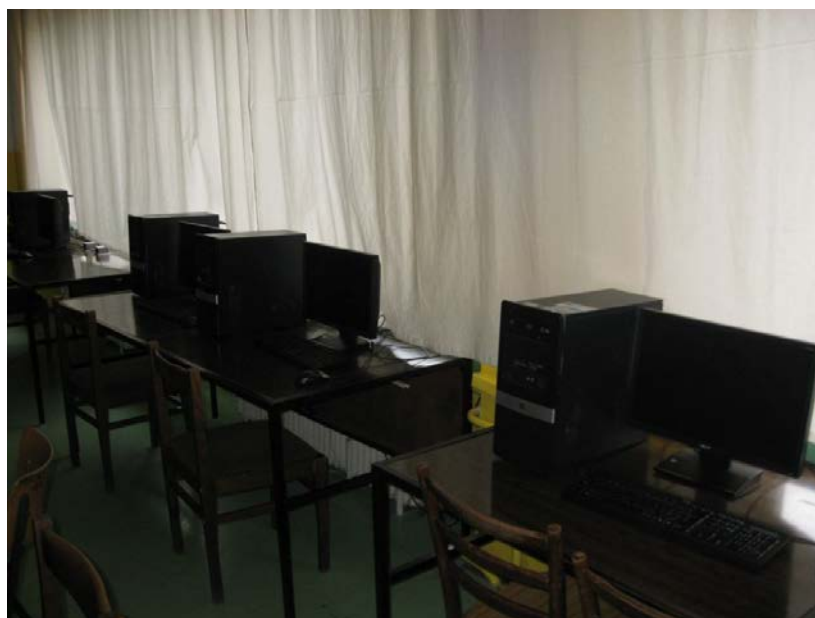
Fotografia č. 3 Učebňa s novo zakúpenými počítačmi