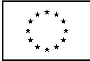
Európska únia Štrukturálne fondy

V prípade, že prijímateľ nemá k dispozícii farebnú tlačiareň, obdĺžnik, hviezdy a text vytlačiť v čiernej farbe.