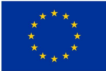
Európska únia Štrukturálne fondy