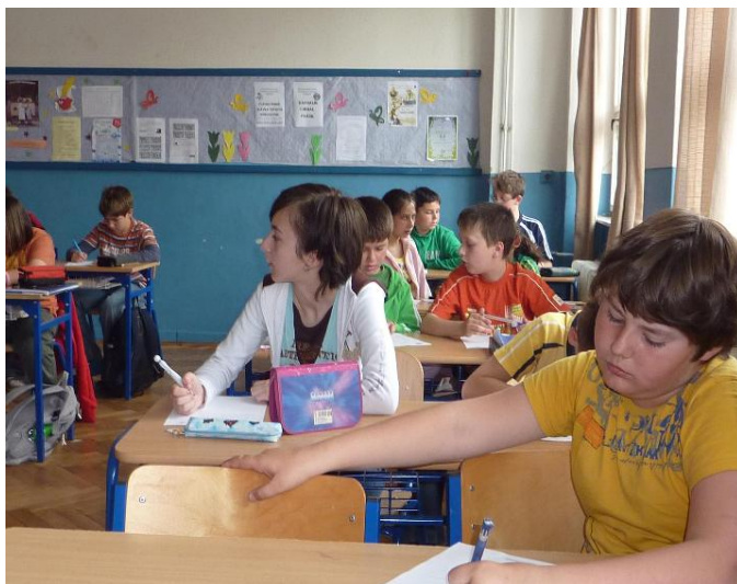
Fotografia č. 1: Vyučovacia hodina pred realizáciou projektu