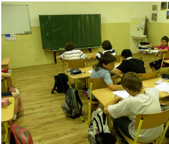
Fotografia č. 2: Vyučovacia hodina pred realizáciou projektu