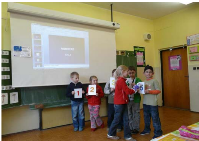
Fotografia č. 4: Realizácia vyučovacej hodiny novou metódou