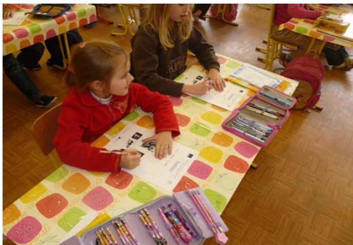
Fotografia č. 5: Využívanie nových pracovných listov