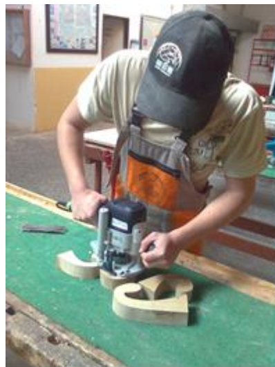
Fotografia č. 4 Odborný výcvik – stolár a odborný výcvik – operátor drevárskej a nábytkárskej výroby

V rámci aktivít projektu prebehla inovatívna prestavba vzdelávania na škole aj zmenou metód vyučovania. Vyučovaci proces pedagógovia žiakom zatriktívnil pomocou rôznych hier, cvičení, experimentálnych metód a interaktívnou formou s novými didaktickými prostriedkami napríklad. Zmeny boli uskutočnené v predmetoch biológia; odborný výcvik - stolár; odborný výcvik – operátor drevárskej a nábytkárskej výroby. Pedagógovia aplikovali do vyučovacieho procesu mnohé poznatky z absolvovaných školení, ako napr. digitálna biológia, digitálny obsah vzdelávania, využívanie prostriedkov informačných a komunikačných technológií vo vyučovacom procese, súčasné trendy v drevárskej a nábytkárskej výrobe, žiacke projekty. Výsledným výstupom realizácie projektu je inovatívne myslenie a vzdelávanie v modernej škole. Naplnenie cieľov projektu zatriktívnilo vzdelávanie a prípravu žiakov pre ich plnohodnotný život. Úspešne zrealizovaný projekt sa stal nástrojom, ktorý ukázal cestu pre ďalšie strategické zámery rozvoja vzdelávania SOŠ v Turanoch. Škola na projekt realizovaný od februára 2014 do júla 2015 získala NFP vo výške viac ako 162-tisíc eur.