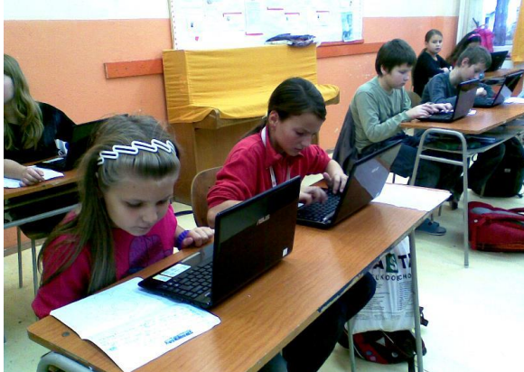
Fotografia č. 1: Hodina práce s informáciami

V rokoch 2009 až 2011 realizovala Základná škola s materskou školou Karola Rapoša v Brezne projekt, na ktorý získala NFP vo výške 153-tisíc eur. Jeho aktivity smerovali k tvorbe, inovácii a implementácii školského