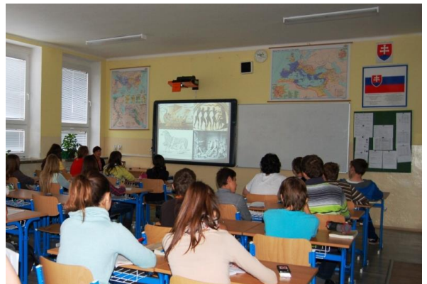
Fotografia č. 2: Využitie IKT vo vyučovacom procese

Projekt s cieľom inovovať učebné materiály, zaviesť moderné metódy a inovatívne formy vzdelávania pre potreby vedomostnej spoločnosti a nadväzujúceho vzdelávania v systéme VŠ realizuje Gymnázium Milana Rúfusa v Žiari nad Hronom v rokoch 2012 až 2015. Škola sa zamerala predovšetkým na prípravu inovatívnych a komplexných učebných materiálov (učebné texty, pracovné listy, pracovné zošity, cvičebnice, banky úloh, videosekvencie a didaktické testy), ktoré pedagógovia využívajú pri výučbe 16-tich vyučovacích predmetov. Okrem iného projekt umožnil vytvoriť odborné učebné texty v anglickom jazyku orientované na rozvoj podnikateľských zručností, videosekvencie z dejepisu zamerané na regionálnu históriu, pracovné listy k reálnym experimentom zo systému IP Coach, či didaktické testy zadávané a vyhodnocované pomocou hlasovacieho zariadenia. Vďaka projektu žiaci i učitelia majú k dispozícii nové počítače, notebooky, prezentačnú a digitálnu techniku, moderné učebné pomôcky, aktuálnu odbornú literatúru i softvérové vybavenie. Moderná didaktická technika skvalitňuje prípravu žiakov na ďalšie štúdium a zároveň im otvára cesty k úspechu