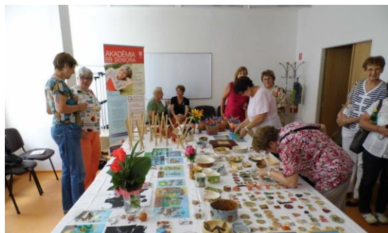
Fotografia č. 5: Záverečná výstava vytvorených prác účastníkov kurzov práca s hlinou, drotárskych techník, maľby na sklo

Cieľom projektu „Akadémia BB seniora“ mesta Banská Bystrica je podporiť aktívne starnutie a rozvoj kľúčových kompetencií seniorov vo svojom meste. Projekt prispieva k zvyšovaniu vedomostnej úrovne seniorov, čo im umožní aj perspektívnejšie uplatnenie na trhu práce. Výstupom projektu bude vzdelávací program zložený z 9 modulov, ako sú ZÁKLADY KOMUNIKÁCIE V ANGLICKOM JAZYKU, ZÁKLADY PRÁCE S PC, KOMUNIKAČNÉ ZRUČNOSTI A ZVLÁDANIE