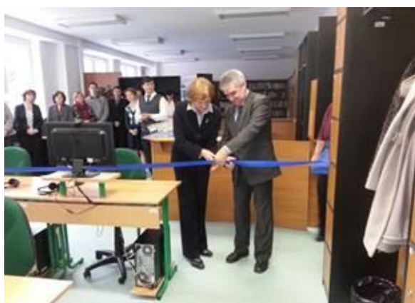
Fotografia č. 3: Otvorenie samovzdelávacieho strediska pre výučbu študijných programov v cudzích jazykoch

Univerzita Mateja Bela v Banskej Bystrici sa projektom „Podpora výučby študijných programov v cudzích jazykoch“ rozhodla zatraktívniť svoje študijné odbory využitím cudzích jazykov a spoluprácou so zahraničnými univerzitami. Zvýšená bola odborná jazyková vzdelanosť vysokoškolských učiteľov a študentov univerzity, podporená medzinárodná spolupráca pri tvorbe a inovácii študijných programov realizovaných s partnermi v zahraničí. V rámci tohto projektu univerzita pripravila a ponúkla osem nových študijných programov v cudzích jazykoch (anglický, nemecký, francúzsky), ktoré môžu študenti študovať na štyroch fakultách univerzity. UMB nadviazala partnerstvá