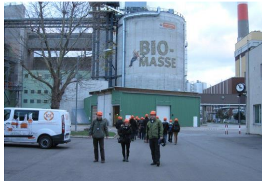
Fotografia č. 4: Prehliadka elektrárne na lesnú biomasu v Simmeringu v rámci mobility zamestnancov

realizované na zahraničných pracoviskách výskumu a vývoja. Účastníkov vedú špičkoví zahraniční pracovníci vedy a výskumu. Súčasťou projektu sú aj špecializované kurzy zamerané na zvýšenie jazykových kompetencií, zvýšenie informačnej gramotnosti a štatistických zručností. Realizujú sa aj iné odborné školenia zamerané na oblasť drevárstva, spracovania dreva a lesníctva s cieľom využitia znalostí v praxi. V rámci jazykového vzdelávania je zavedená výučba čínskeho jazyka, o ktorú prejavili študenti vysoký záujem. Mnohí už nadviazali s ázijskými krajinami pracovné vzťahy a uvedomujú si dôležitosť znalosti tohto jazyka pre prax. V súčasnosti totiž veľmi rýchlo rastie nielen podiel špičkových výskumných tímov z ázijských krajín, ale aj spolupráca v podnikateľskej oblasti. Náplňou kurzov je zvládnutie komunikácie v čínštine bez výučby zložitého čínskeho písma. Univerzita získala na projekt „Zvýšenie kapacity ľudských zdrojov pre transfer poznatkov výskumu a vývoja o produkcii a spracovaní biomasy do praxe“ NFP vo výške milión 515-tisíc eur. Realizuje ho od júna 2013 a plánuje ukončiť v máji 2015.