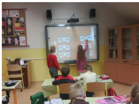
Fotografia č. 1: Projektové vyučovanie

Prostredníctvom štyroch hlavných aktivít realizovala v rokoch 2009 až 2011 Základná škola v Lendaku projekt, ktorého hlavným cieľom bola profilácia školy smerom k záujmom a vzdelávacím potrebám žiakov, požiadavkám rodičov a k aktuálnym a perspektívnym potrebám vedomostnej spoločnosti a trhu práce. V rámci realizácie aktivít boli učitelia vyškolení na nové učebné postupy a odbory, bol zmenený a doplnený školský vzdelávací program. K projektu patrili aj prierezové témy - zdravotná, dopravná a environmentálna výchova, ktoré boli integrované do učebných osnov predmetov. Vďaka projektu má škola