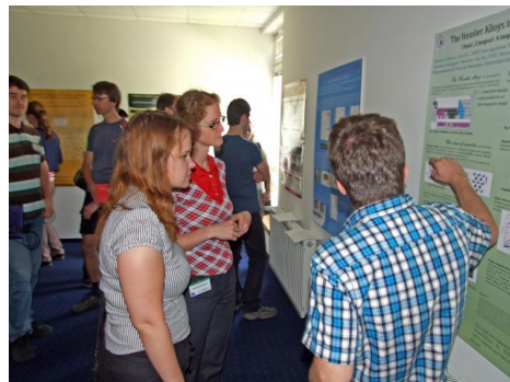
Fotografia č. 10: Doktorandi UPJŠ

Samotný názov projektu „Modernizácia programov doktorandského štúdia v prírodných a humanitných vedách na UPJŠ (DOKTORAND)“ je zároveň aj jeho strategickým cieľom. Nadviazali na neho viaceré aktivity, v rámci ktorých boli vytvorené a inovované sylaby existujúcich a novovytvorených predmetov, ako aj spoločné programy so zahraničnými univerzitami. Medzinárodný rozmer škola získa vďaka novým programom doktorandského štúdia v anglickom jazyku. Výstupom aktivít projektu je moderný systém vysokoškolského vzdelávania na treťom stupni univerzitného štúdia v prírodných vedách – v matematike, v informatike a v humanitných vedách, konkrétne v neslovanských jazykoch a literatúre. Projekt vytvoril dlhodobé medzinárodné partnerstvá a podporil vedecko-pedagogické spolupráce. Doktorandi UPJŠ získali všetky predpoklady na to, aby sa stali lídrami v oblastiach ekonomicko-spoločenského rozvoja, a to nielen v regióne východného Slovenska, ale i v celej EÚ. Univerzita projekt realizovala v rokoch 2010 až 2013 a získala naň NFP vo výške viac ako 978-tisíc eur.