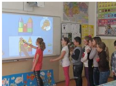
Fotografia č. 5: Príklad vytvoreného digitálneho doplnkového učebného materiálu

Využívali prezentácie prác z vlastnej tvorby, aktivity s využitím internetu, tlačných a elektronických médií, knižníc (napr. čítanie webových stránok obsahovo príbuzných danému predmetu, čítanie novín, magazínov, komiksov, encyklopédií). K spestreniu výučby patrili aj vytvorené didaktické hry, úlohy, príklady na rozvíjanie a testovanie kompetencie. Projekt zahŕňal aj výskumnú činnosť, induktívne metódy, t.j. využívanie názorov a cvičení pri utvrdzovaní a aplikácii učiva, metódy rozvoja kritického myslenia, praktické práce a iné. Inovácia vyučovacieho procesu sa dotkla aj cudzích jazykov, hlavne anglického, tiež ruského a nemeckého jazyka. Pedagógovia počas projektových školení získali najnovšie poznatky z metakognitívnych stratégií na získanie čitateľských zručností, z oblasti tvorby vlastných učebných materiálov a pedagogickej dokumentácie aj v digitálnej forme. Škola na projekt realizovaný v období rokov 2012 až 2014 získala NFP vo výške viac ako 197-tisíc eur.