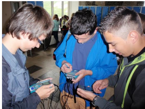
Fotografia č. 3.: Meranie teploty, tlaku a nadmorskej výšky v teréne

Škola zaviedla e-learning do vyučovania piatich predmetov a zmodernizovala tak vyučovací proces. Celková výška NFP na projekt predstavovala 161-tisíc eur.