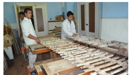
Fotografia č. 8: Na hodine stavebnej výroby

členný kolektív pedagógov. Hlavným zámerom projektu je zlepšenie materiálo-technického vybavenia, inovácia odborných výučbových programov a vzdelávanie pedagógov všetkých štyroch elokovaných pracovísk. Pedagógovia absolvujú školenia zamerané na IKT, odborné vzdelávanie, ako aj na komunikáciu so žiakmi MRK – s cieľom zlepšenia komunikácie s rómskymi žiakmi a ich rodičmi.