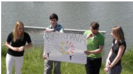
Fotografia č. 9: Na hodine Ekonomiky v prírode

Pedagógovia Obchodnej akadémie Polárna z Košíc spracovali projekt „Moderné vyučovanie odborných predmetov na obchodnej akadémii pre potreby regionálneho trhu práce“ s cieľom zaviesť najnovšie metódy a trendy vo vyučovaní. Nové učebné materiály vytvorili aj na základe požiadaviek od zamestnávateľov v regióne. Škola inovovala školský vzdelávací program o interaktívne vyučovanie PODNIKOVEJ EKONOMIKY v 1. ročníku a blokovo vyučovanie odborných predmetov v 3. ročníku, ako sú napr. PODNIKOVÁ EKONOMIKA, ÚČTOVNÍCTVO, ADMINISTRATÍVA A KOREŠPONDENCIA, PRÁVNA NÁUKA. V rámci PODNIKOVEJ EKONOMIKY zaradili kurz EKONOMIKY V PRÍRODE a žiaci 3. ročníka absolvovali program blokovo vyučovania odborných predmetov s využitím inovovaných didaktických prostriedkov v cvičnej kancelárii. NFP vo výške 123-tisíc eur získala škola v jednej z prvých výziev vyhlásených ASFEU ešte v roku 2008. Projekt realizovala v rokoch 2009 až 2012.