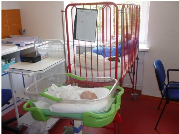
Fotografia č. 2: Učebňa na ošetrovanie detských pacientov

Stredná odborná zdravotnícka škola v Prešove realizovala v rokoch 2009 až 2012 projekt zameraný na skvalitnenie výstupov vzdelávania pre potreby vedomostnej spoločnosti inováciou obsahu a metód vzdelávania s vyšším využitím informačno-komunikačných technológií. Vďaka projektu v škole nainštalovali dve interaktívne tabule, 17 notebookov, dva dataprojektory a bola zriadená nová učebňa na ošetrovanie detských pacientov. Žiaci sa pomocou nových pomôcok ako postieľka, prebaľovací stôl, vanička, váha či figurína môžu učiť ošetrovať novorodencov v reálnom prostredí. Odborná učebňa pre vyučovanie predmetu PRVÁ POMOC získala figurínu na