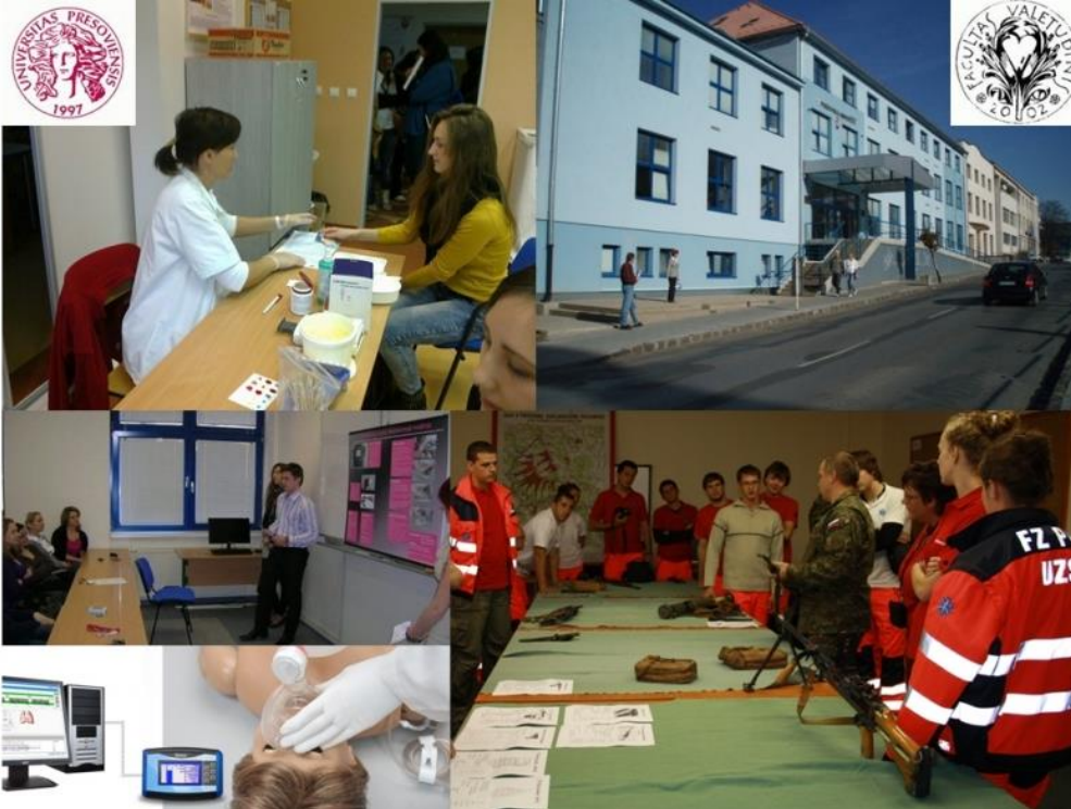
Fotografia č. 4: Vzdelávanie a odborná prax účastníkov projektu Prešovskej univerzity

nielen zvýšený záujem o štúdium, ale aj o celú vzdelávaciu inštitúciu. Vzhľadom na neustále sa meniacu legislatívu, nové metódy a trendy sa univerzita snaží prispôbiť štúdiu požiadavkám praxe a rozvinúť kľúčové kompetencie študentov a učiteľov, navrhnúť pre nich motivačné prvky a v neposlednom rade zmeniť priority i proces vzdelávania. Študijné materiály a učebné texty vytvorené na základe najnovších vedeckých poznatkov s ohľadom na skúsenosti z praxe budú