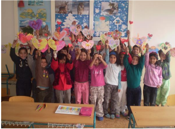
Fotografia č. 6: Tvorivé vyučovanie

Základná škola Ľudmily Podjavorinskej v Košiciach sa vo svojom projekte „Zvyšovanie vzdelanostnej úrovne príslušníkov marginalizovaných rómskych komunít“ zamerala ako na žiakov, tak aj na učiteľov. Cieľom dvoch hlavných aktivít bolo inovovať obsah a metódy vzdelávania na podporu čitateľskej gramotnosti žiakov z MRK, pre ich ľahšiu inklúziu vo vedomostnej spoločnosti. Za účelom zlepšenia spôsobilosti žiakov porozumieť písanému textu, používať ho a premýšľať o ňom boli vytvorené učebné materiály, pracovné zošity a metodiky. Vďaka projektu je